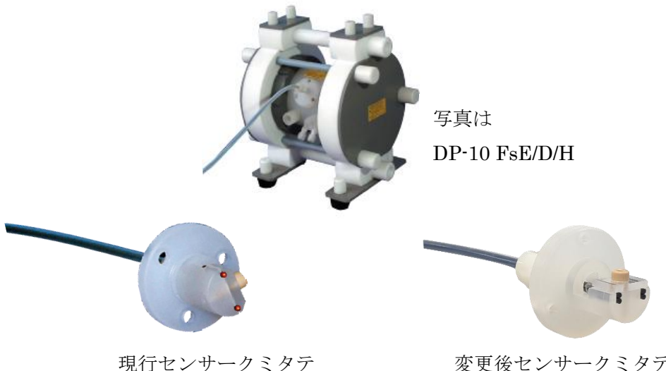
現行センサークミタテ

新旧センサークミタテは、ポンプに対し互換性がございます。ヒカリファイバーの変更に伴いまして、合わせてご使用いただくアンプ、ケーブル(ポンプ別売品)も変更となります。