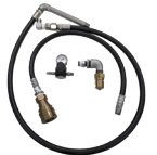
排出ホースセット