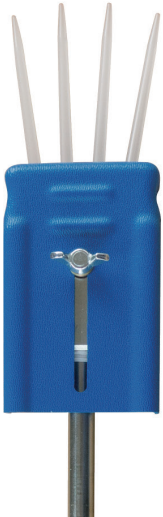
ベアリング給脂用ニードルノズル GP-NA (805226)