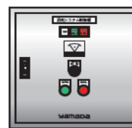
⑥排気システム制御盤(0.55kW)